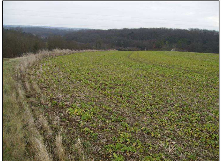
Photo 3 : Champ de colza situé entre le Ru de Prunay et la Touloupe