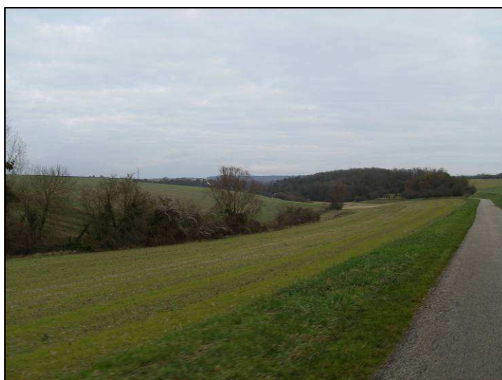
Photo 1 : Blé d'hiver le long de la route reliant Prunay-le-temple à Septeuil

Les cultures sont constituées de Blé d'hiver, le long de la route de Septeuil et au lieu-dit « Les Pendants », (Photo 1 et Photo 2), de Colza entre le Ru de Prunay et la Touloupe (Photo 3) ou de terres en jachères (Photo 4).